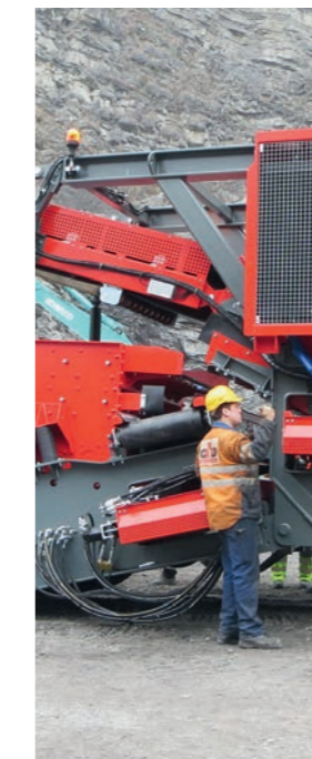
Einfaches An- und Abkoppeln der Siebeinheit