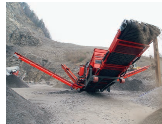
Mit dem 3-Deck-Siebkasten können drei qualifizierte Endkörnungen ausgesiebt werden