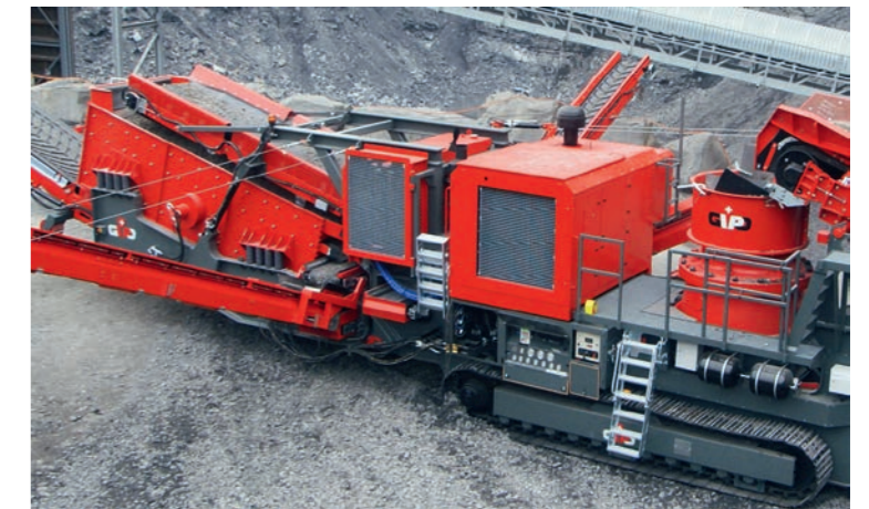
GIPOCONE B4 GIGA mit einem 3-Deck-Siebkasten