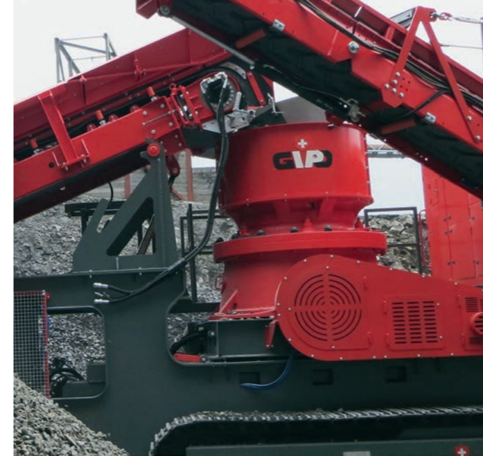
Der GIPO Kegelbrecher im Hartgesteinseinsatz (3900 kg/cm 2 )

Le GIPOCONE vient compléter la vaste gamme des produits GIPO. Fort des avantages proposés par les produits GIPO, le broyeur à cône GIPO se distingue également par sa flexibilité de production et par un broyage à haute efficacité. Grâce à sa productivité de premier rang et à son excellente forme de grain, le GIPOCONE constitue un choix optimal pour les deuxième et troisième niveaux de broyage. Équipé d'un caisson de criblage à 3 niveaux à haut rendement, le GIPOCONE crée une nouvelle catégorie dans le domaine du sable de concassage et de broyage.